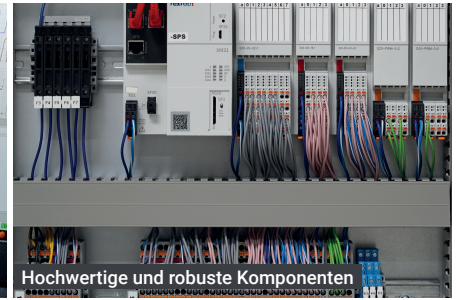
Hochwertige und robuste Komponenten