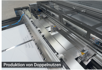
Produktion von Doppelnutzen