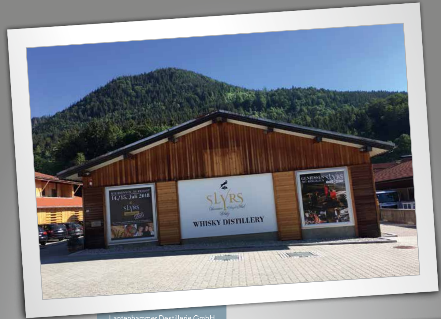
Lantenhammer Destillerie GmbH Format 2,32 x 2,67 m