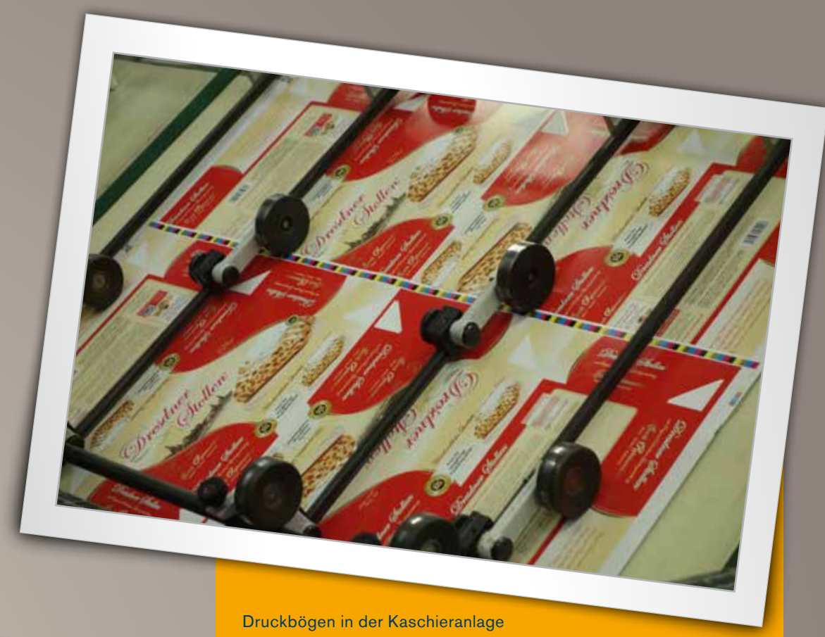
Druckbögen in der Kaschieranlage