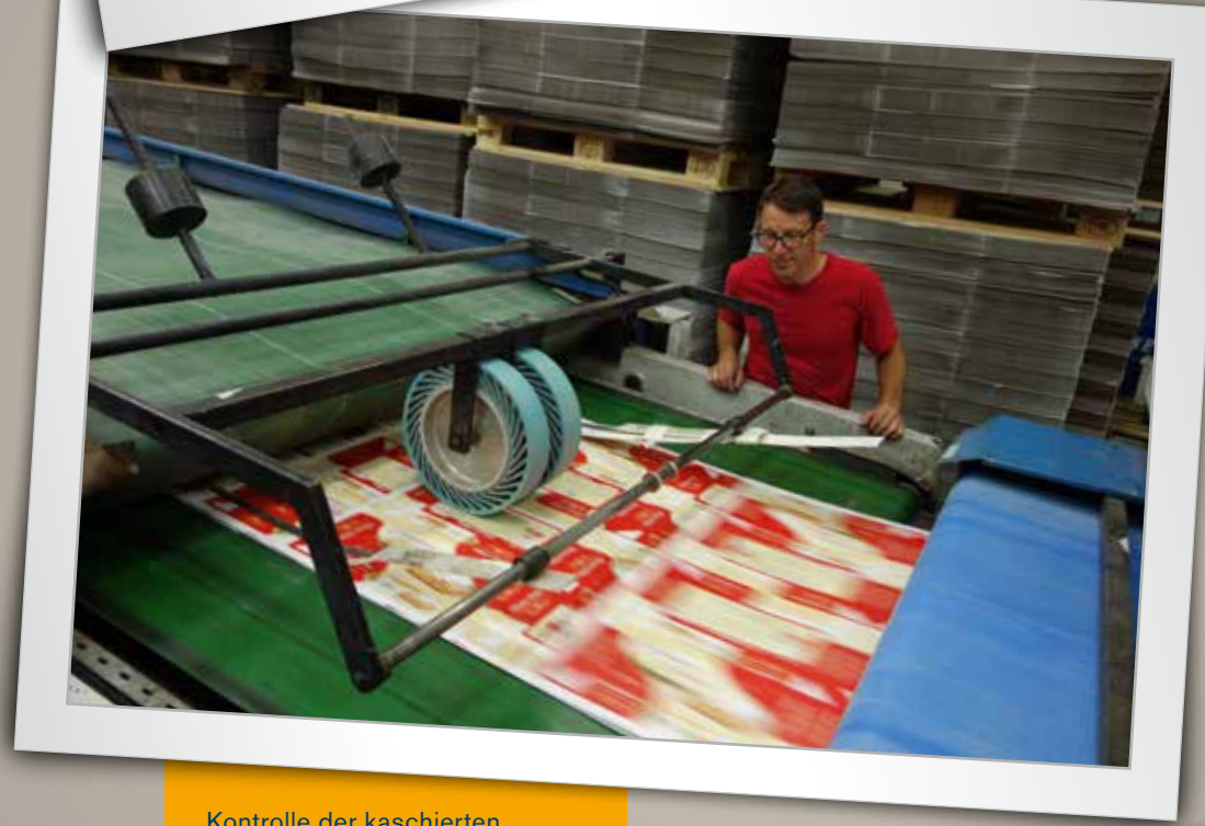
Kontrolle der kaschierten Druckbögen