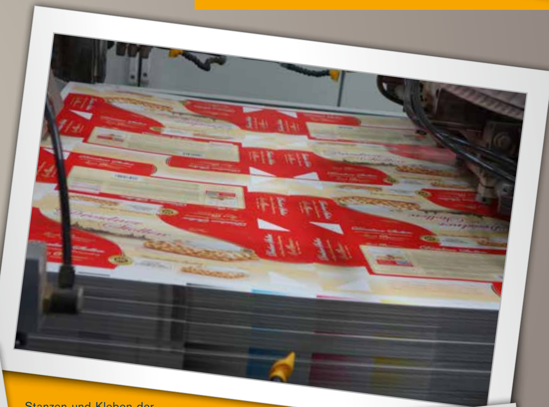
Stanzen und Kleben der Stollenverpackungen