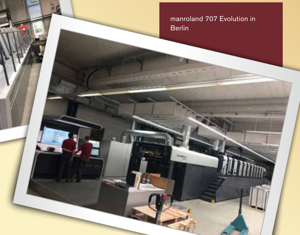
manroland 707 Evolution in Berlin

Das Kaltfolienmodul zaubert faszinierende Metallic-Effekte schnell und kosteneffizient auf die Druckbögen – inline in nur einem Druckdurchgang. Die Kaltfolie wird wie eine zusätzliche Farbe behandelt und benötigt keine weiteren speziellen Werkzeuge oder Formen. Durch die Kaltfolieneinheit lässt sich der Kaltfolienverbrauch optimal anpassen. Das Aufbringen der Folie ist bei maximaler Druckgeschwindigkeit möglich. Bei unserer Speedmaster XL 106 sind das bis zu 18.000 Bogen pro Stunde. Nach dem Kaltfolienauftrag kann im selben Durchgang mehrfarbig gedruckt und lackiert werden. Die veredelten Druckbögen lassen sich sofort weiterverarbeiten, ohne dass Zwischenschritte nötig sind. Dadurch verkürzen sich die Auftragsdurchlaufzeiten gegenüber einem Offline-Verfahren enorm – auch wegen des schnellen Umrüstens.