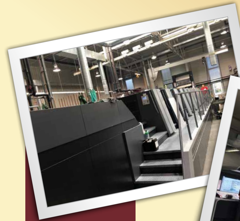
Heidelberg Speedmaster XL 106 in Glücksburg