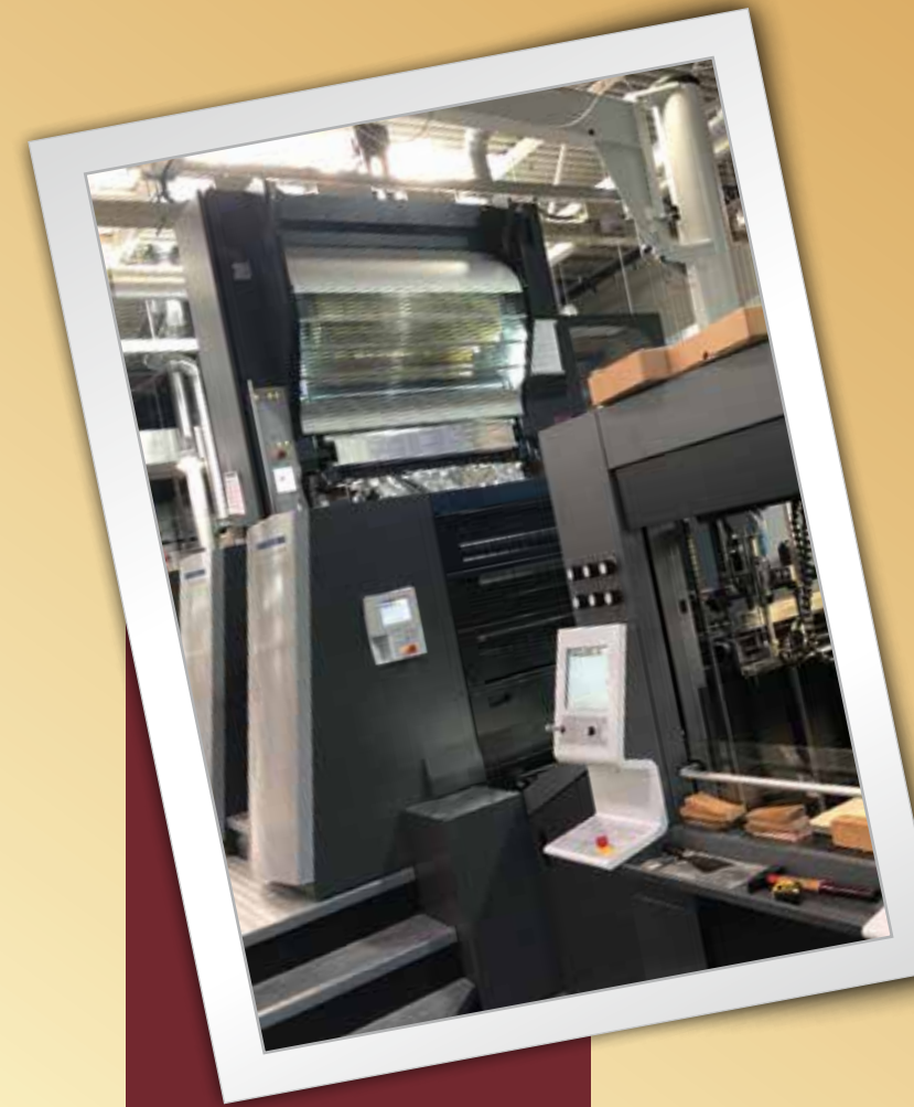
Kaltfolienmodule FoilStar von Heidelberg