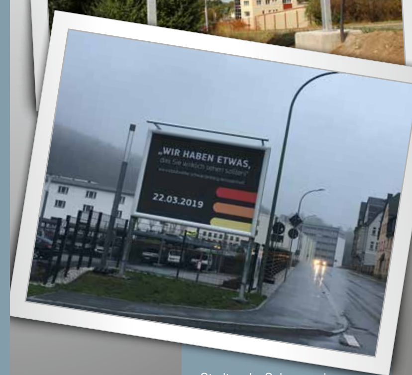
Stadtwerke Schwarzenberg Format 3,56 x 2,52 m