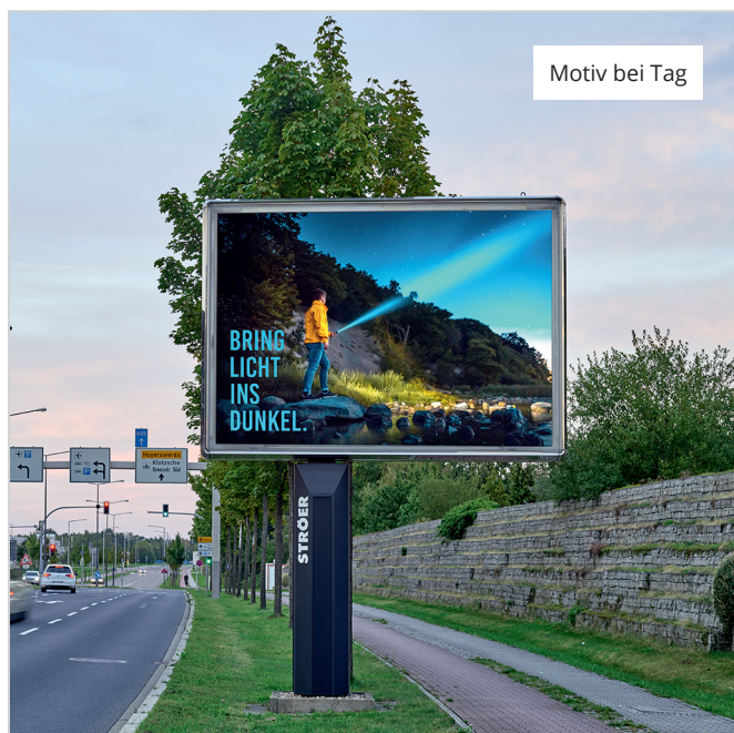
Motiv bei Tag