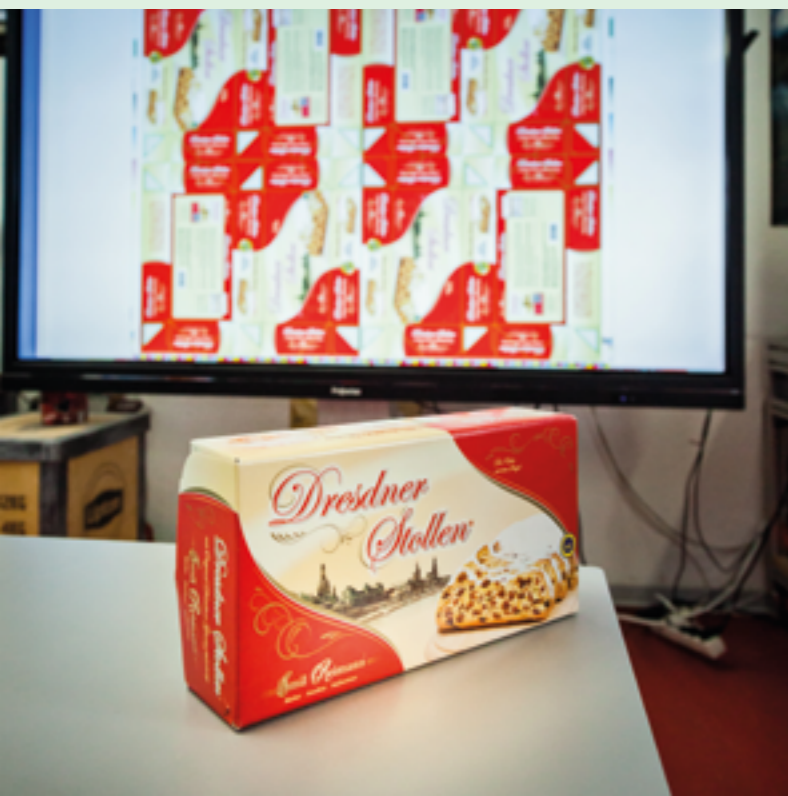
Auf dem Monitor sehen die Experten, ob das Dekor richtig sitzt.

Ellerhold ist ein inhabergeführtes Unternehmen in der Druckbranche. Der Firmensitz liegt in Radebeul. Dort werden Großplakate für die Innen- und Außenwerbung sowie Displays und Verpackungen hergestellt.