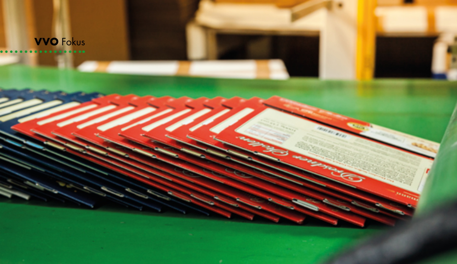
Ausgeliefert werden die Stollenkartons platzsparend in gefalteter Form.